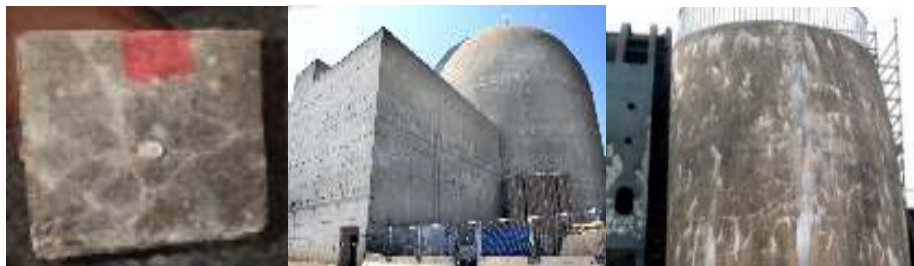
شکل ۱- ترک خوردگی سطحی و پاشیدگی ژل سفید رنگ بر اثر واکنش قلیایی - سیلیسی بر روی سطح بتن

ترک‌های سطحی، جابجایی نسبی و پاشیدگی ژل سفید رنگ از جمله علائم ظاهری ایجاد شده در بتن توسط واکنش قلیایی - سیلیسی است. عمده‌ترین شیوه‌ی ظاهر سازی واکنش، ترک‌های سطحی نقشه ماند است که دارای جهات تصادفی می‌باشد. اگرچه مشکلات دوامی دیگری نیز مانند چرخه ذوب و انجماد و حمله سولفاتی نیز چنین ترک‌هایی را ایجاد می‌کنند.