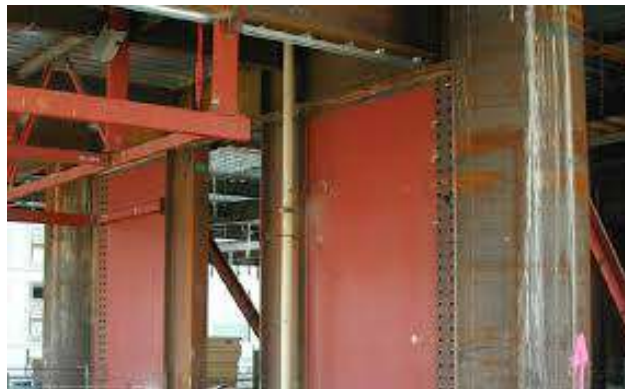
شکل ۲- سطح صاف فولادی