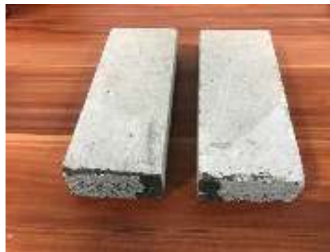
شکل ۹- آزمایش کشش ناشی از خمش (تعیین مدول گسیختگی)

این آزمایش بر روی نمونه های متعددی انجام شد و مقاومت کششی بالایی بین ۳۰ تا ۳۵ کیلوگرم بر سانتی متر مربع به دست آمد. این مقاومت از مقاومت کششی بتن نیز بالاتر است و پاسخگوی تمام ملات اندود می باشد.