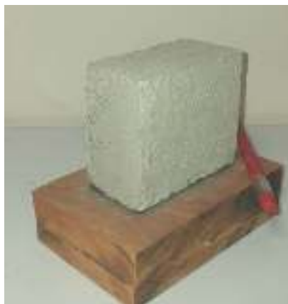
شکل ۱۷- اجرای محصول جدید روی چوب