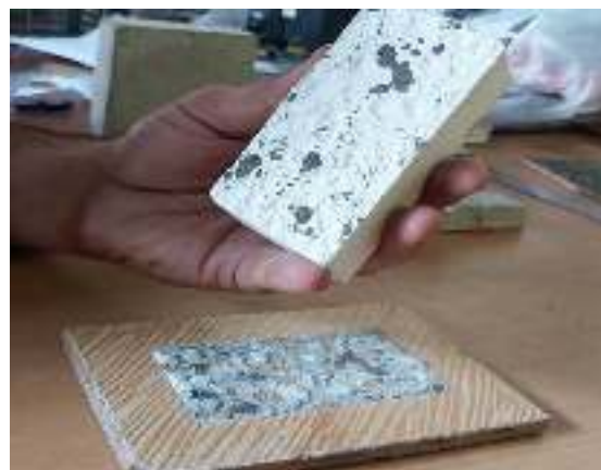
شکل ۱۴- سطح درگیری محصول جدید با سرامیک