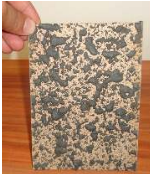
شکل ۵- اجرای محصول جدید بر روی چوب