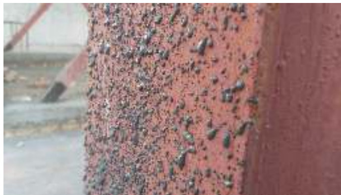
شکل ۲۰- پلیمر مضرس کننده بر روی ستون فولادی