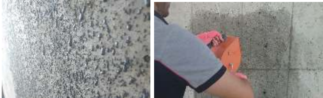
شکل ۱۹- اجرای پلیمر مضرس کننده بر روی دیوار برشی بتنی

در شکل های ۱۹ و ۲۰ نمونه هایی از اجرای این محصول روی سطوح صاف بتنی و فولادی نشان داده شده است.