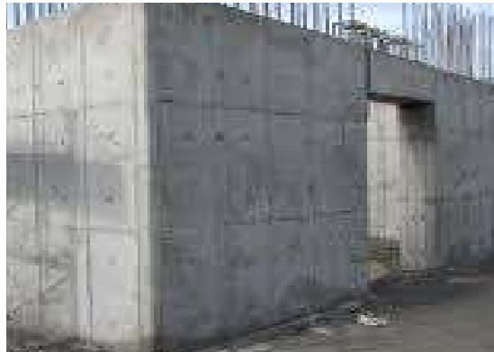
شکل ۱- سطح صاف و صیقل دیوار برشی