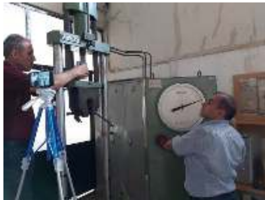
شکل ۶- دستگاه آزمایش

در شکل ۷ مقطعی که محصول نوین بر روی آن اجرا شده‌است بصورت شماتیک نشان داده شده‌است. مهم این است که اثبات شود که مقاومت کششی چسب از مقاومت کششی بتن بیشتر است؛ البته توجه شود که اگر این محصول روی دیوار برشی اجرا می‌شود و سپس روی آن اندودی نظیر گچ اجرا می‌شود کافی است مقاومت کششی این چسب از اندود بیشتر باشد با توجه به اینکه بر مقاومت‌ترین اندود متعارف بتن (سیمان) است. دو قطعه بتنی با ابعاد که توسط محصول نوین به هم متصل شده‌اند در شکل ۸ بصورت شماتیک نشان داده شده و بار متمرکز در ناحیه اتصال اعمال شده‌است. همانطور که در شکل ۹ مشاهده می‌شود، چسب قسمتی زیادی از بتن را برداشته‌است و این نشان‌دهنده این است که مقاومت کششی ناشی از خمش در رزین از مصالح پایه یعنی بتن بیشتر است؛ همچنین از این چسب روی اندود استفاده می‌شود و الزاماً نه روی خود بتن، در نتیجه الزامات مورد نیاز را برآورده می‌کند.