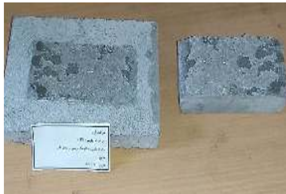
شکل ۱۲- سطح درگیری محصول جدید روی بتن