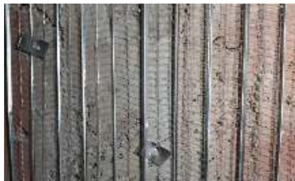
شکل ۴- اتصال رابیتس به سطح زیر کار

۵- اضافه شدن ضخامت اندود رویی: اساسا استفاده کردن از رابیتس یا توری مرغی شکم دادگی بوجود آمده در اجرا به گونه ای خواهد بود که ضخامت اندود رویه در صورتیکه حتی نیاز نداشته باشیم به زیر ۳ سانتی متر نخواهد آمد.