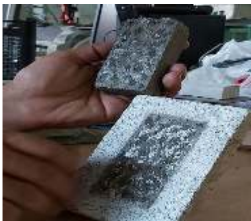
شکل ۱۵- سطح درگیری محصول جدید با موزاییک