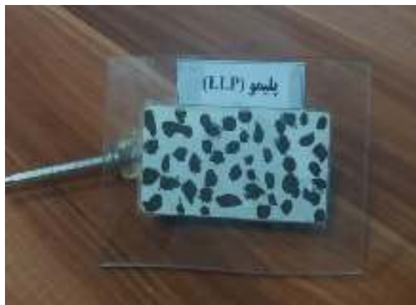
شکل ۱۶- سطح درگیری محصول جدید با شیشه