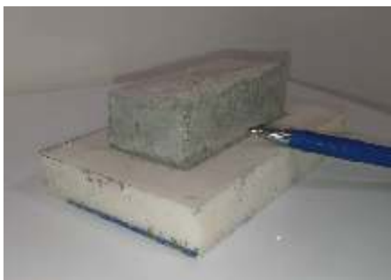
شکل ۱۸- سطح درگیری محصول جدید با Xps

جدول ۱- آزمایش برش سطحی محصول جدید بر روی سطوح مختلف