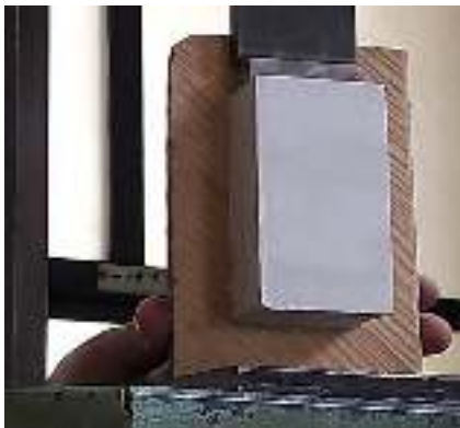
شکل ۱۳- آزمایش محصول جدید روی سرامیک