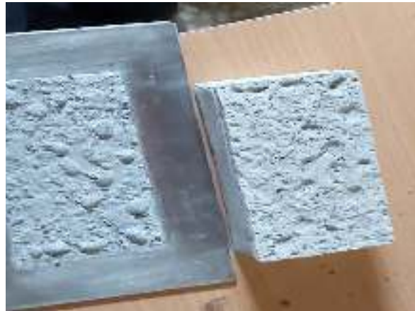
شکل ۱۰- سطح درگیری محصول جدید با فلز