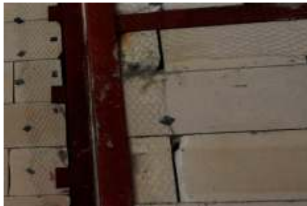
شکل ۳- استفاده از توری مرغی و اتصال آن به سطح زیرکار (بلوک)

توری مرغی در ساختمان‌سازی برای بالا بردن استحکام به کار می‌رود. ساختار شبکه‌ای شش ضلعی توری مرغی نیرو را در جهات مختلف تقسیم و باعث می‌گردد که اندود جدید به سطوح زیرکار متصل گردد. روش‌های اتصال توری مرغی به زیرکار در صورتیکه سطح زیرکار دارای صلیبیت مناسب باشد همانند سطوح بتنی یا فلزی توسط ورقه‌های فلزی مربع شکل در فواصل ۲۵ الی ۳۰ سانتی‌متری توسط دستگاه میخکوب متصل می‌گردد. در صورتیکه سطح زیرکار از صلیبیت لازم جهت استفاده از دستگاه میخکوب برخوردار نباشد همانند پلاستوفوم از روش منگنه کردن جهت ایجاد اتصال استفاده می‌نمایند (شکل ۳). در نهایت عملکرد اتصال به گونه‌ای خواهد بود که اندود جدید در چشمه‌های توری مرغی تقسیم شده تا بتوان از جدایش ملات با زیرکار جلوگیری نمود. در حقیقت ملات توسط توری مرغی در چشمه‌های ۶ ضلعی چنگ زده می‌شود و توری مرغی با اتصال میخکوب به زیرکار متصل می‌باشد.