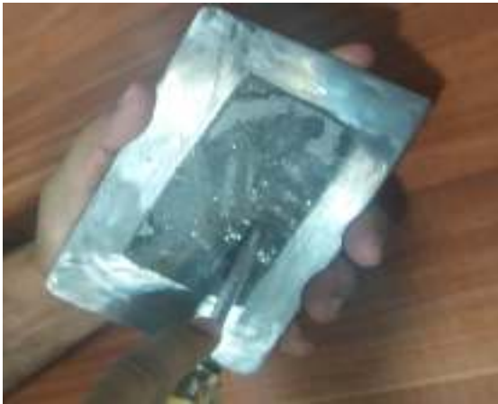
شکل ۱۱- چسبندگی بالای محصول جدید روی فلز