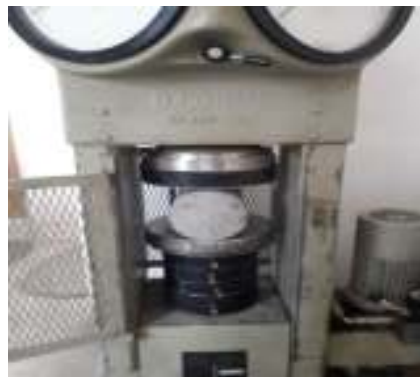
شکل ۴- آزمایش مقاومت کششی (برزیلی)

به منظور تعیین مقاومت کششی آزمایش کشش غیر مستقیم بتن (برزیلی) انجام می دهیم (ASTM-C496)، در این روش که به آزمایش دو نیم شدن نیز معروف است نمونه استوانه ای (نمونه استوانه ای استاندارد) بتن به صورت خوابیده روی دو صفحه فولادی به صورت فکی قرار داده می شود، که در این حالت نیروی وارده بر قطر استوانه به صورت تدریجی و با سرعت ۰٫۲ کیلو نیوتن بر ثانیه وارد می شود. نتایج زمانی مورد قبول است که شکستگی در راستای بار گذاری و عمود بر سطح مقطع نمونه تشکیل گردد.