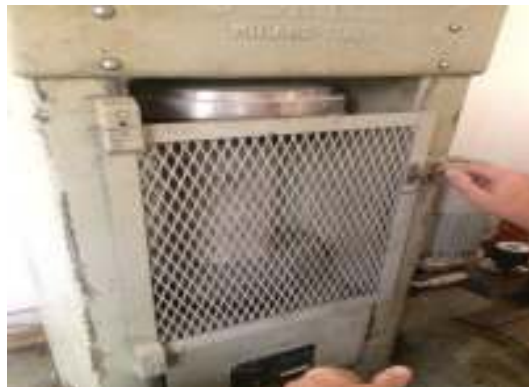
شکل ۳- آزمایش مقاومت فشاری

مقاومت فشاری بتن که با بارگذاری محوری یک جهته نمونه استوانه ای به دست می آید، مقاومت فشاری تک محوره نامیده می شود. این آزمایش مطابق استاندارد ASTM-C1۹۲ انجام شده است.