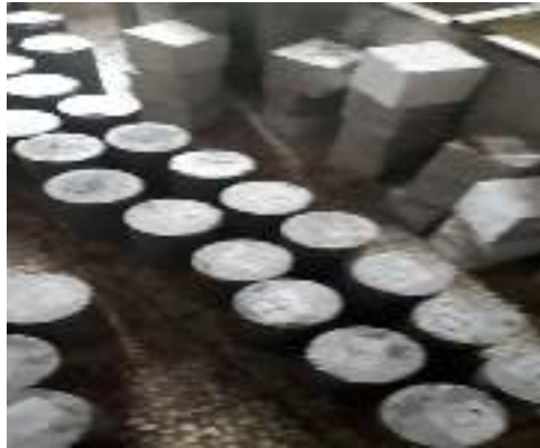
شکل ۲- نمونه های ساخته شده بتن پلیمری

شد و این اتفاق زمانی می افتد که رزین در معرض هوای آزاد و دمای محیط باشد در صورتی که ما حرارت بیشتری را با استفاده از پخت آون یا شتاب دهنده ها به رزین مایع اعمال نماییم، می توانیم روند سخت شدن آن را از چند دقیقه تا چند ساعت تنظیم کنیم. در صورتی که از شتاب دهنده و یا آون برای پخت رزین در بتن پلیمری استفاده شود اکثر بافت های رزین در اثر پلیمریزاسیون به طور کامل در آنها انجام نشده که با قرار دادن نمونه های بتنی در فضای باز این عمل تکمیل و بتن از روز های اول سخت تر شده و مقاومتش بیشتر خواهد شد.